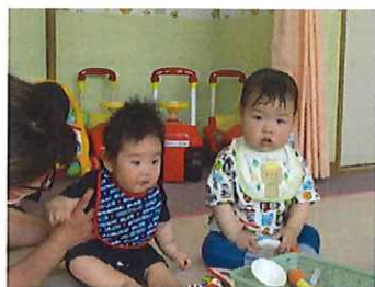
同級生で~す!! 仲良くしようね♡