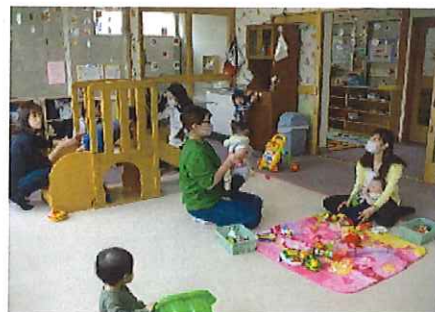
今月は、たくさんお友達が 来てくれました。楽しいね~