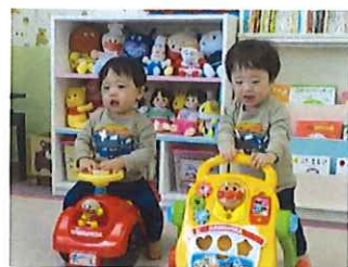
2人一緒に よーいドン!!