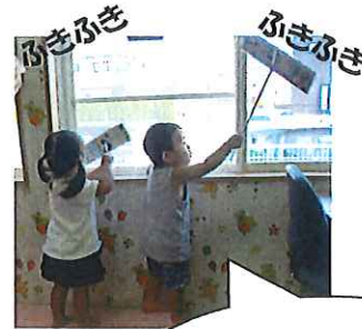
ちらして作った クイックルワイパー♪

子どもたちの笑顔いっぱいの支援センター。1、2歳児のお友だちは、言葉が達者になって、大人顔負けの発言に大笑い! 0歳児のお友だちは、続々と誕生日をおかえ、歩き出した子、高速ハイハイに高速伝い歩き、色々な仕草も身につけて、日々の成長に感動しています!