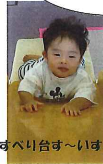
すべり台す~いすい