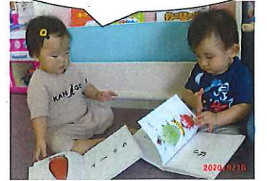
読書の秋 愛読書はだるまさん♡